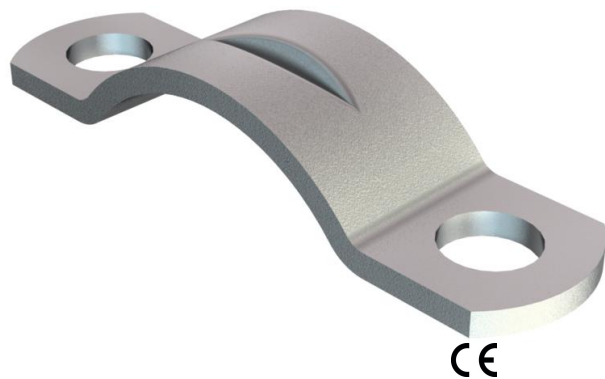
Obejma odprężająca 9mm